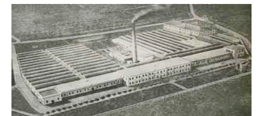
Chiari antica: Calzificio Ambrosi